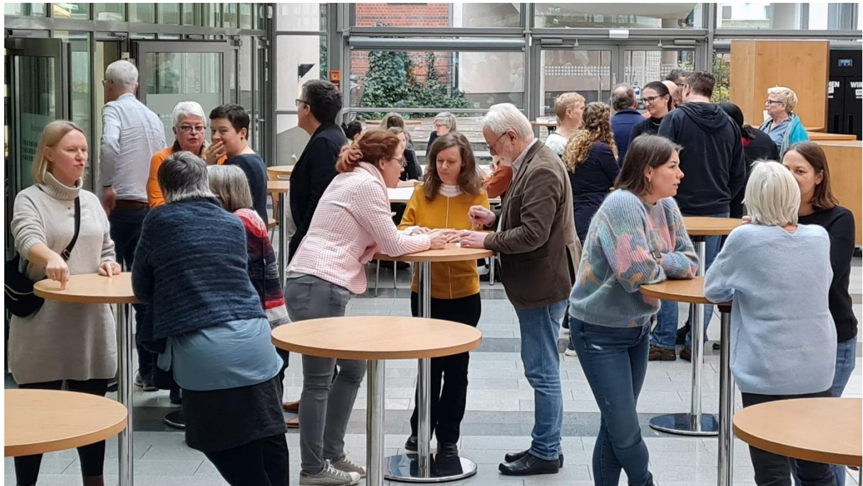
Intergremientreffen 2023 in Berlin